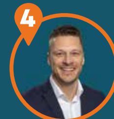
4 Raphael Schäfer, 1981 Abgeordneter des Saarländischen Landtages