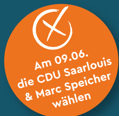
Bürgermeister Carsten Quirin