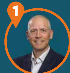
1 Tim Flasche, 1972 Vizepräsident des Landgerichts